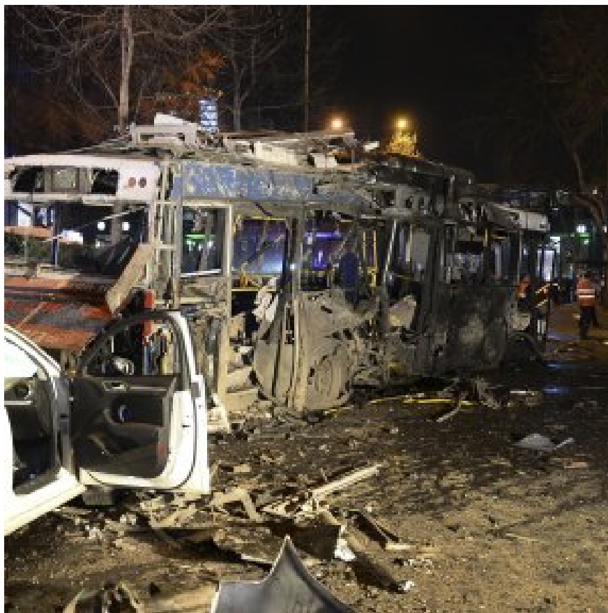
(Il luogo dell'ultimo attentato ad Ankara)

Martedì 15 Marzo 2016 14:11 - Ultimo aggiornamento Martedì 15 Marzo 2016 22:40