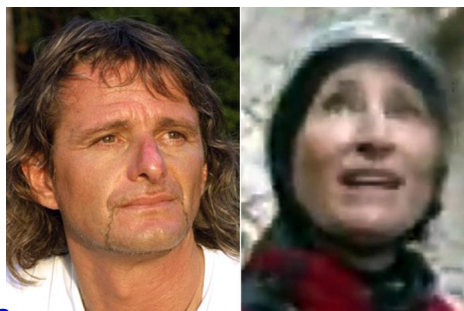
Nepal: 4 al momento le vittime italiane - Asia