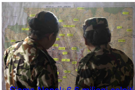
Sisma Nepal: 6,6 milioni colpiti - Mondo

Martedì 28 Aprile 2015 09:32 - Ultimo aggiornamento Martedì 28 Aprile 2015 09:47