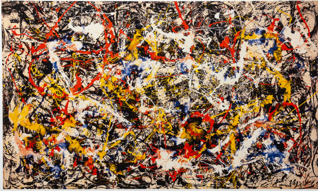
Jackson Pollock Convergence Albright-Knox Art Gallery

Giovedì 09 Aprile 2026 10:34 - Ultimo aggiornamento Mercoledì 15 Aprile 2026 09:50