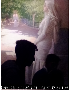
Stanley Spencer, L'Ultima cena , 1920, Cookham, Stanley Spencer Gallery