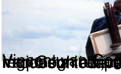
Museo di San Pietro, Roma, 1860 circa, Città del Vaticano, Musei Vaticani