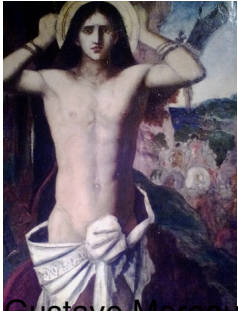
Gustave Moreau, San Sebastiano , 1870-1890, Parigi Museo Gustave Moreau

Lunedì 16 Novembre 2015 10:37 - Ultimo aggiornamento Venerdì 20 Novembre 2015 10:36