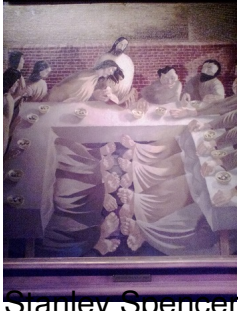
Stanley Spencer, L'Ultima cena , 1920, Cookham, Stanley Spencer Gallery