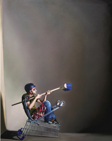
Fig. 9 (Stephen Johnston, Trolley Wars, www.stephen-johnston.co.uk ) internazionale per un