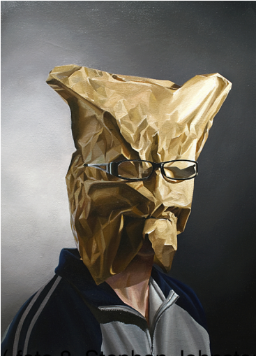
Fig. 8 (Stephen Johnston, Short Sighted, www.stephen-johnston.co.uk )

Mercoledì 20 Novembre 2013 20:43 - Ultimo aggiornamento Giovedì 21 Novembre 2013 14:57