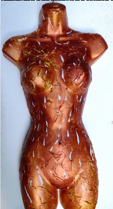
Fig. 10 (Stephen Johnston, The Venus of Willendorf, www.stephen-johnston.co.uk )